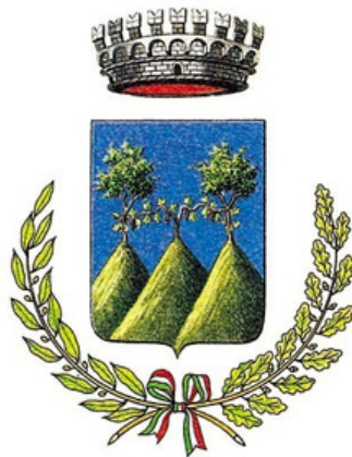
Comune di Maser