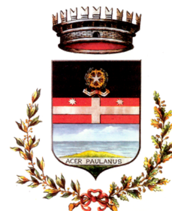
Comune di Povegliano