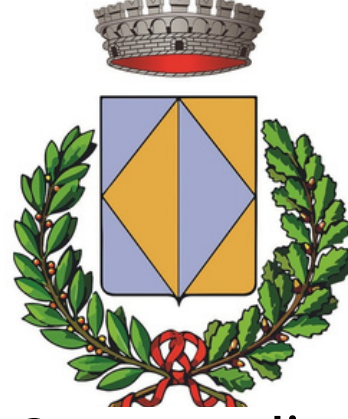
Comune di Istrana