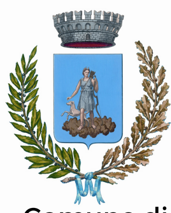
Comune di Valdobbiadene