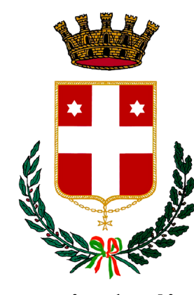
Città di Oderzo