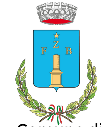
Comune di Zenson di Piave