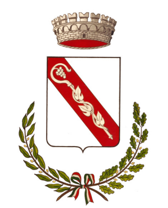
Comune di San Vendemiano