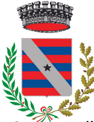
Comune di Fontanelle