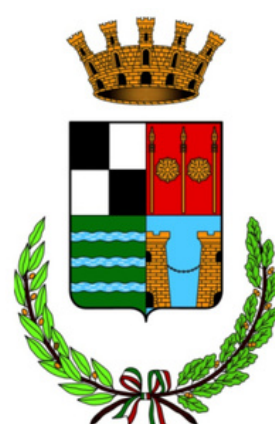
Città di Villorba