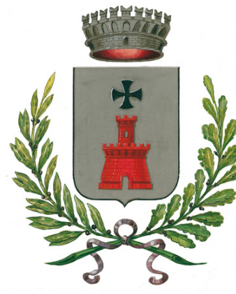
Comune di Farra di Soligo