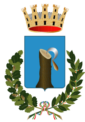
Comune di Roncade