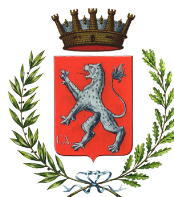
Città di Asolo