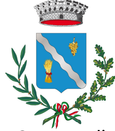
Comune di Mareno di Piave