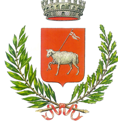
Comune di Mansuè