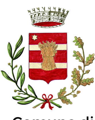
Comune di Sarmede