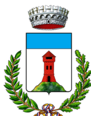
Comune di Cavaso del Tomba