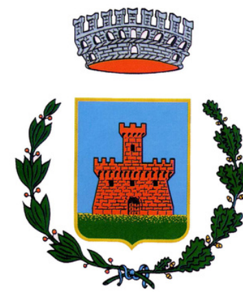
Comune di Breda di Piave