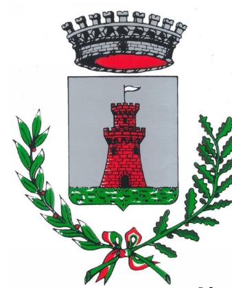
Comune di Ponte di Piave