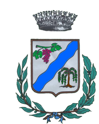
Comune di Salgareda