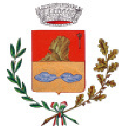
Comune di Revine Lago