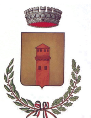
Comune di Casale sul Sile