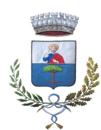
Comune di San Biagio di Callalta