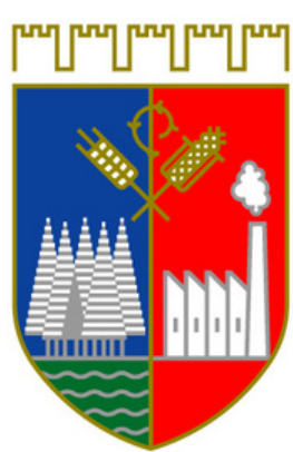
Città di Preganziol