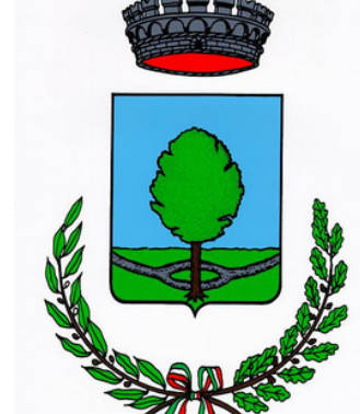
Comune di Cimadolmo