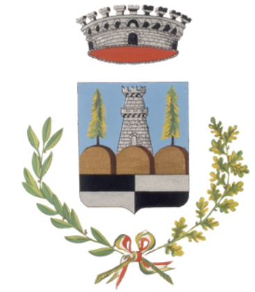
Comune di Nervesa