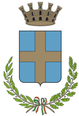
Città di Conegliano