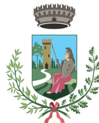
Comune di Montebelluna