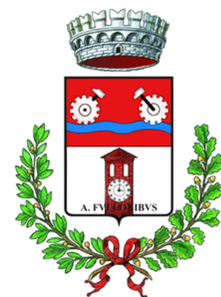
Comune di Follina