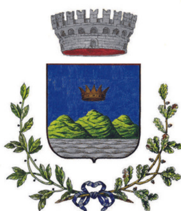
Comune di Altivole