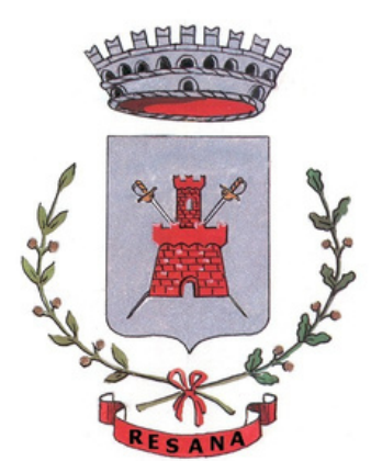
Comune di Resana